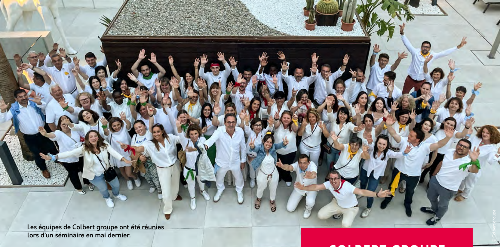
Les équipes de Colbert groupe ont été réunies lors d'un séminaire en mai dernier.

Management, Optiméo Retraite va devenir Colbert Expertise Retraite. Nous lançons en septembre un site internet groupe qui renverra sur les sites des différentes structures, mais qui permettra d'informer sur nos différents métiers.