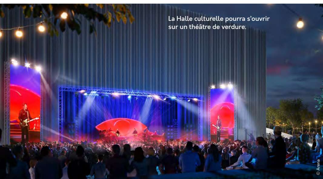
La Halle culturelle pourra s'ouvrir sur un théâtre de verdure.

Anoncé il y a plus de dix ans, le projet ambitieux des Sables d'Olonne Arena est entré dans sa phase concrète. La première pierre du vaste complexe sportif et culturel a été officiellement posée le 5 juin dernier, donnant le coup d'envoi des travaux. Livraison prévue en 2025 .