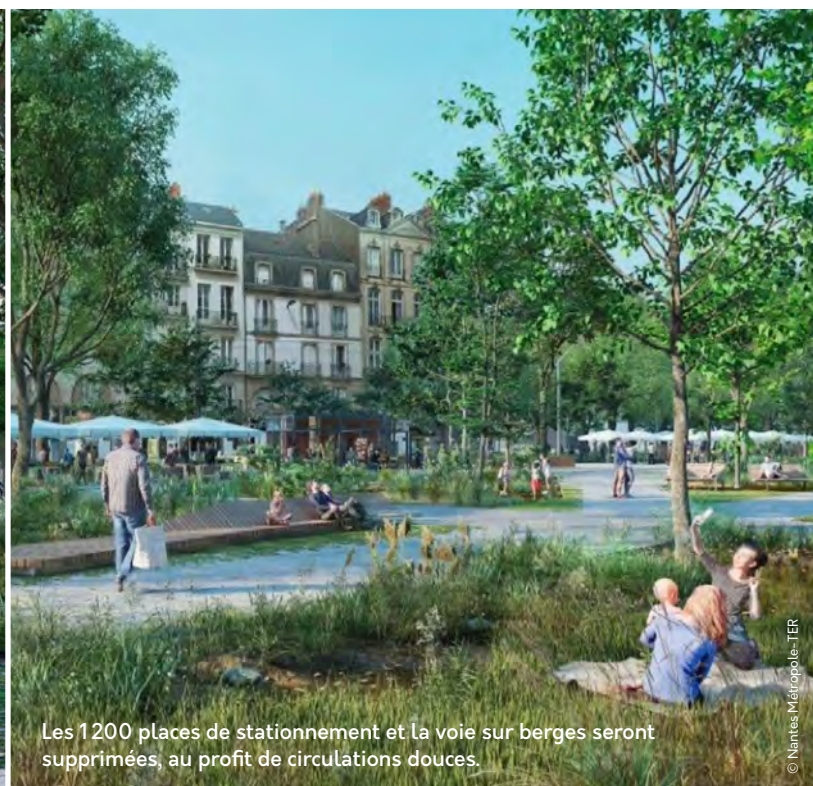
Les 1200 places de stationnement et la voie sur berges seront supprimées, au profit de circulations douces.