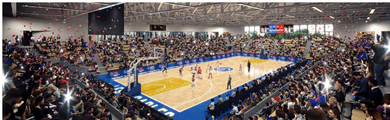
La Halle sportive sera modulable grâce à ses tribunes rétractables.