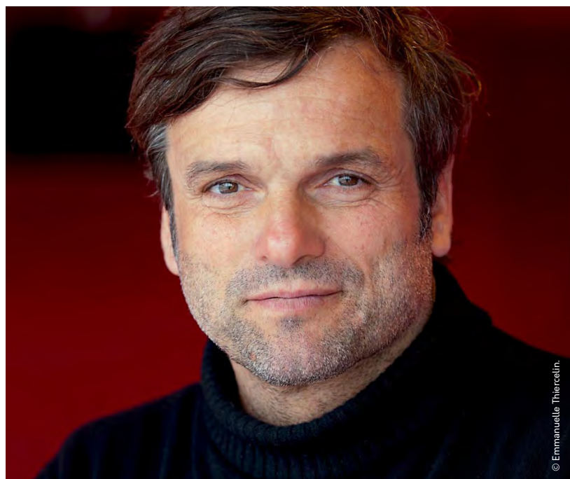
Le navigateur Marc Thiercelin animera une conférence sur sa vision de l'efficacité énergétique dans le milieu maritime.

Le navigateur Marc Thiercelin (cinq tours du monde en solitaire et quatre Vendée Globe à son actif) ouvrira la journée avec une conférence sur sa vision de l'efficacité énergétique dans le milieu maritime. Suivront plusieurs tables rondes. La première, de 9h30 à 10h15, s'intéressera au contexte énergétique actuel (enjeux, réglementation, opportunités). La